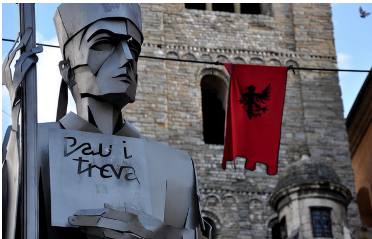
Monument commemoratiu de les assemblees de Pau i Treva de Déu (Vic, Osona).

Una de les moltes actuacions que el Bisbe Abat Oliba va fer per donar a aquell país en formació, que dubtava com desenvolupar-se, estructurar-se i projectar-se en la història, fou la seva gran capacitat de mediador en els conflictes, aconseguint un gran prestigi que el portà a la consecució d'una pacificació del territori a través de la creació de la famosa Pau i Treva de Déu , que s'estengué a molts altres indrets d'Europa, per la qual cosa, un historiador com Antoni Pladevall l'ha assenyalat com el primer “ català universal ”.