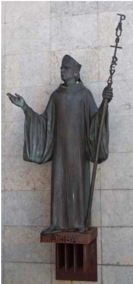
Estatua de l'Abat Oliba (Ripoll, Ripollès).

Haurà de pactar amb el levita Guillem la delimitació dels límits dels castells de Tous i de la Roqueta (1023), la recuperació de les esglésies parroquials del gran terme de Gurb, usurpades pel noble Bernat Sendret de Gurb (1032), i en particular la possessió del terme de Calaf i altres dominis annexes ocupats i organitzats en nom de l'església de Vic pel levita Guillem de Mediona el 1015, però reclamats pels vescomtes de Cardona, que al·legaven una cessió anterior que els feu el comte de Barcelona: la sentència d'Oliba reconeixent el dret dels Cardona i l'esforç de Vic és tot un exemple de justícia i equitat ( Diplomatari , docs. 77, 105 i 130).