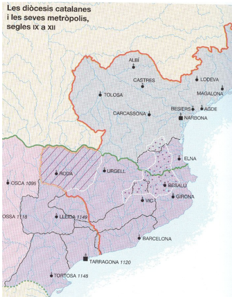
Diòcesis i metròpolis a Catalunya, segles IX a XII.

diòcesis coincidien, en bona part, amb els límits dels comtats i s'anaren ampliant amb les terres recuperades amb l'avançament de la reconquesta.