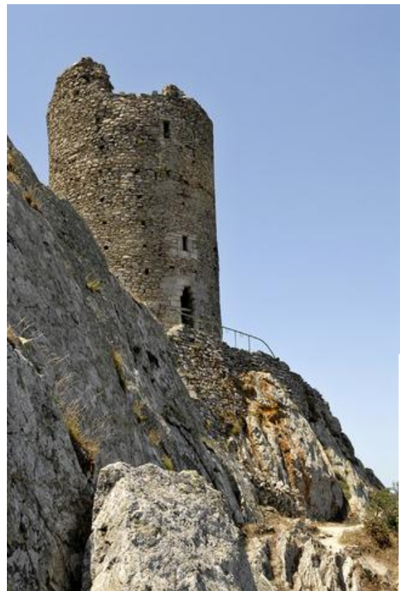
La Torre de la Maçana.

Aquesta torre protegia l'estratègic pas de la Maçana a la serra de l'Albera, pas usat des de l'antiguitat, tot i l'alçada, ja que és un pas des d'on es controla el mar.