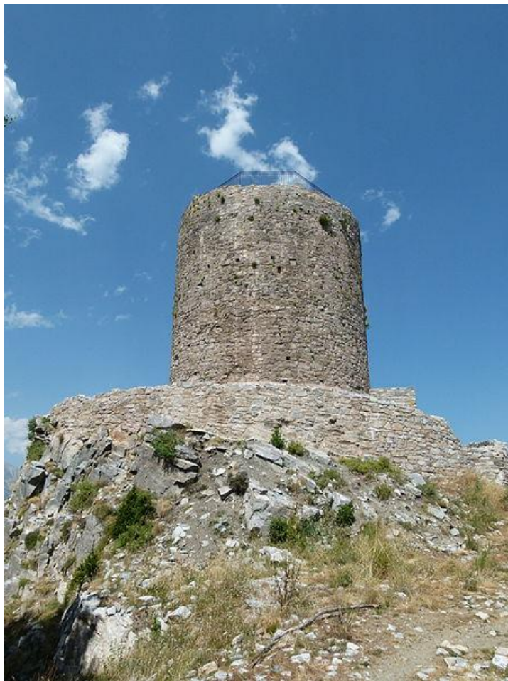
La Torre del Mir, en l'actualitat.

És en aquest darrer període, el tombant entre els segles XII i XIII que la vigilància del territori a Occitània, i els conflictes associats, porten a la construcció de les anomenades torres de guaita, com la Torre del Mir, per part dels comtes del casal de Barcelona. Aquestes torres, situades sempre en llocs alçats i amb una visió estratègica de les valls, són un element característic més, avui en dia, del Pirineu Oriental.