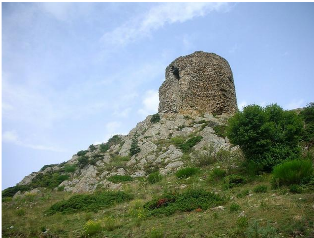
La torre de Vetera, en un estat de conservació no tan bo com el d'altres torres de guaita de la Catalunya Nord.

La torre de Vetera acomplia un doble funció: feia tasques de vigilància del territori, i a més també formava part d'un sistema de transmissió de senyals que es feia mitjançant foc a la part superior. Això la permetia (juntament amb la torre de Cos) connectar Cortsaví amb els castells de Mollet (Montferrer) i de Cabrenç (Serrallonga).