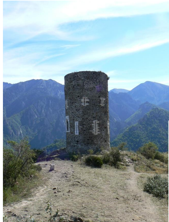
La Torre de Goà.

És una torre cilíndrica, no eixamplada a la base, d'uns dotze metres de diàmetre. Consta de dos pisos, amb sostres en cúpula, cadascun amb vuit espitlleres emmarcades per blocs de marbre tallat ben aparellats. Al capdamunt de l'edifici hi el terrat pla, que tenia una superfície metàl·lica on els guaites feien foc si calia passar l'alerta d'un perill. Va ser declarada monument històric de França el 1982, i restaurada el 1990.