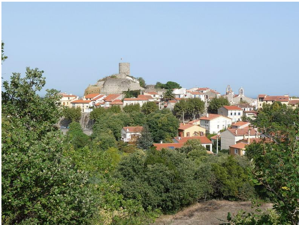
La Roca d'Albera, amb la torre de guaita en lloc privilegiat.

La torre del castell, de 25 metres d'alçada, s'afonà al 1890; va ser reconstruïda, però amb una altura inferior. És rodona i al seu interior hi ha una escala que permet accedir a la terrassa superior, que mostra unes vistes excel·lents de la zona. Aquesta torre havia format part de l'extensa xarxa de torres de senyals que cobria la major part de la Catalunya del Nord.