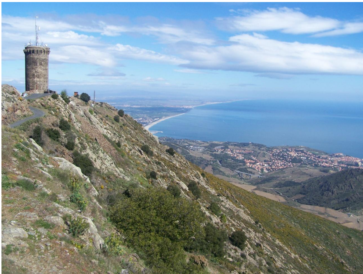
La torre de Madeloc, amb una impressionant vista de la costa rossellonesa.

La Torre Madeloc es troba situada a la població de Port Vendres, al llogar de la Alberes, quan aquestes ja llepen el mar i donen vida a l'esplèndida Costa Vermella. És una talaia magnífica per poder albirar gran part de la Catalunya Nord. Des d'ella podem divisar la plana del Rosselló, amb Perpinyà com a gran ciutat dominant la zona, les Corberes, límit natural dels territoris de llengua catalana, amb l'impressionant castell de Salses com a mut vigilant de la història. Amb una mica de sort, i el dia clar, també podem contemplar la mola del Canigó.