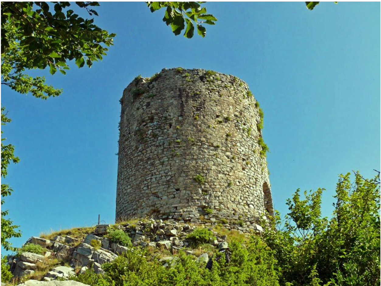
La torre del Mir, el 2007, abans de la restauració.

Declarada monument històric de França el desembre de 2002, la torre va ser restaurada el 2009 i es pot visitar, podent pujar fins a la terrassa superior.