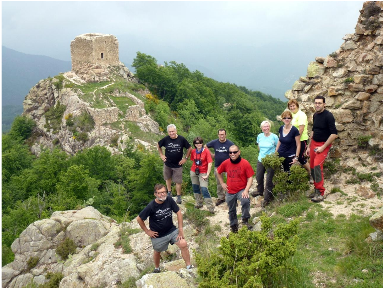
Les Torres de Cabrenç, en una sortida de 100 cims del CM Mollet (maig de 2013).

El conjunt fortificat de Cabrenç, de grans dimensions i el més important de la regió, s'alçava al damunt d'un seguit de cims veïns i molt encinglerats a la serra que fa de frontera entre el Vallespir i l'Alt Empordà. Del castell, del segle IX, es conserva un clos emmurallat que comprèn la torre de l'homenatge i l'església de Sant Miquel de Cabrenç en el cim més al sud, de 1.326 metres d'altitud. En els dos pics més septentrionals, cent i tres-cents metres més enllà, hi ha, respectivament, les ruïnes d'una torre de defensa dins un espai emmurallat (segle XIII) i una torre hexagonal (segle XIV). Fins al segle desè va ser la residència dels lloctinents dels comtes de Besalú al Vallespir. Els barons de Cabrenys, que visqueren al castell fins al segle catorzè, tenien extenses possessions als pobles nord-catalans de Vallespir, Serrallonga, Costoja, Vilaroja, els Horts, Fontanills, Ribelles, Montalbà i Reiners. La residència de la baronia es traslladà a Maçanet de Cabrenys al segle XIV, topònim estretament relacionat amb el d'aquest conjunt monumental.