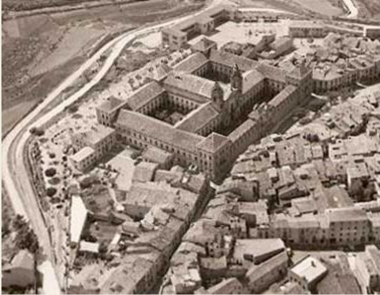
La Universitat de Cervera i la ciutat. Compareu-ne les dimensions amb les cases de la ciutat.

El cert és que Felip V passa per Cervera l'any 1701 i jura el seus privilegis -com era el costum- i també ennobleix el "paer en Cap". En les Corts de Barcelona de 1702, Cervera aconsegueix el títol de Ciutat, en les mateixes corts per les quals s'acceptà el nou sobirà ja que va jurar els privilegis de les constitucions. Però tot sembla indicar que per aquest motiu es formà un nucli de "felipistes agraïts".