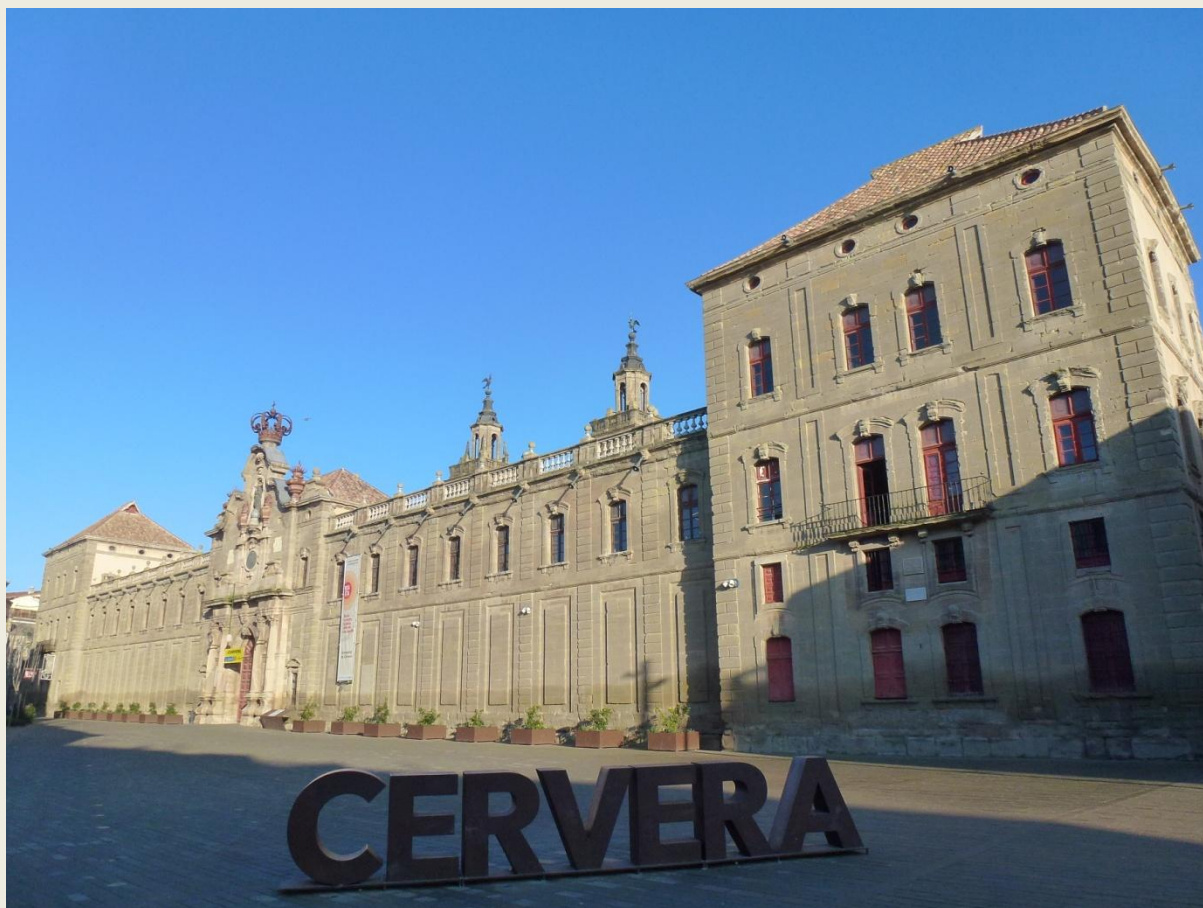
La Universitat, avui

Torras, Josep Ma. (2013). Felip V contra Catalunya. Rafael Dalmau, Editor.