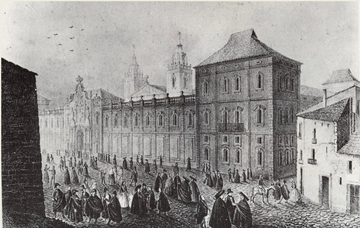
La Universitat de Cervera, en un gravat de F.X. Parcerisa del s. XIX

Els primers catedràtics foren establerts per decisió del capità general, príncep de T'serclaes de Telly, que els va escollir entre els aduldors de Felip V. Fins l'any 1725 no fou convocada la primera oposició per a set càtedres de la facultat de Teologia; tres per a la Facultat de Cànon; tres més per a la de Lleis; quatre a medicina; dues a Filosofia; quatre a Humanitats -dues a Llatí, dues a Grec-; i una a Retòrica.