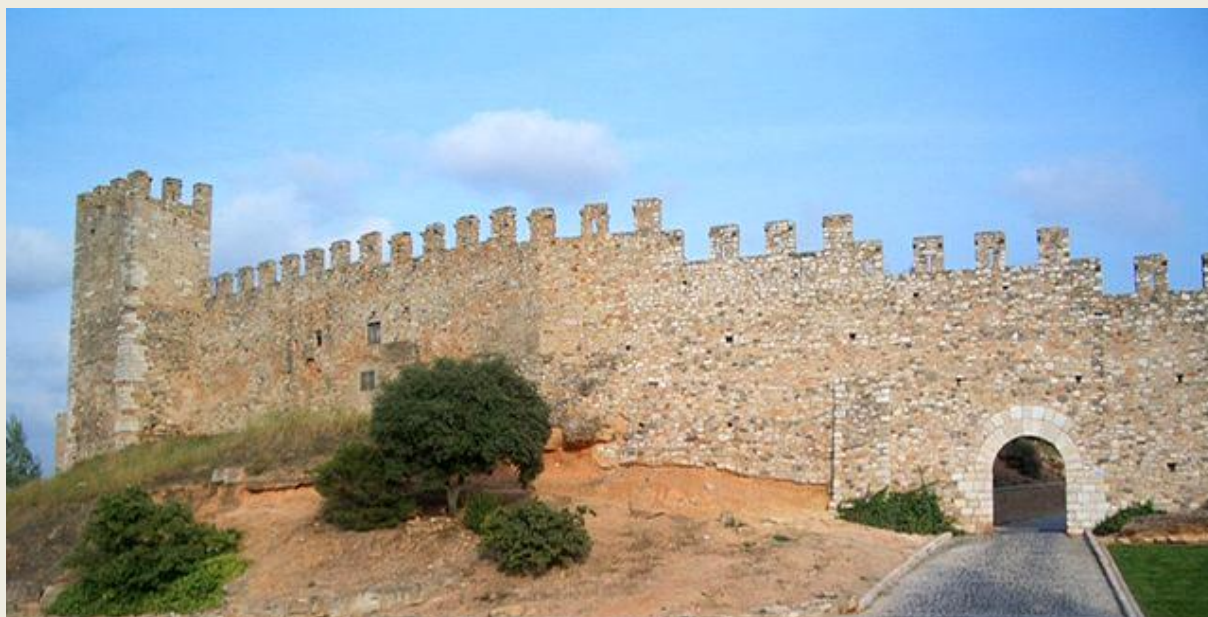
Muralles de Montblanc.