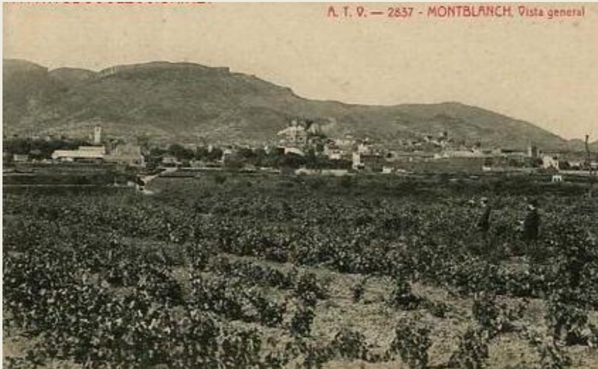
El cultiu de la vinya, al voltant de Montblanc.

vinya, que al s. XIX arriba a ser pràcticament un monocultiu. La creació de noves vies de comunicació afavoriran la comercialització dels seus productes i més encara amb l'arribada del ferrocarril, el 1863, que serà determinant en aquest procés.