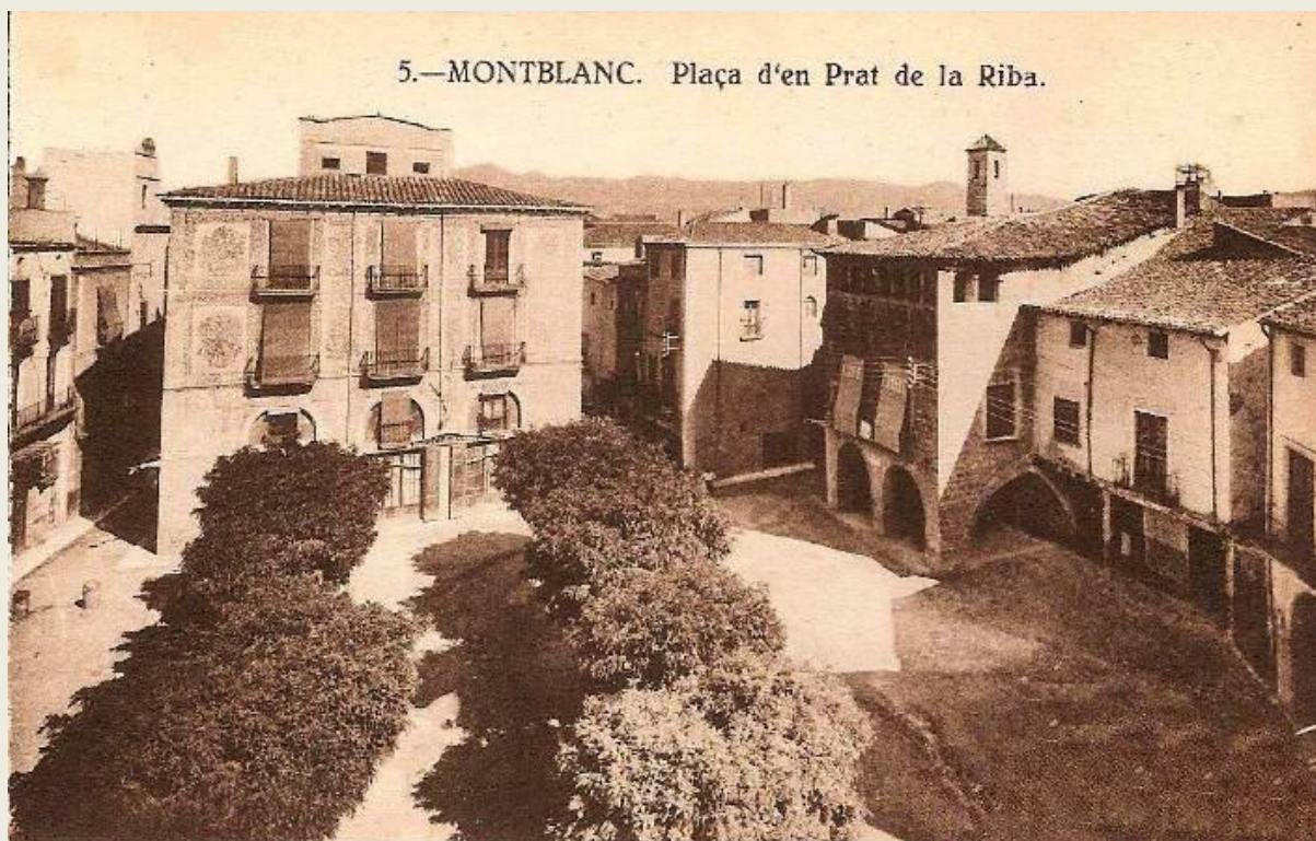
La plaça Prat de la Riba, avui Plaça Major. A la part dreta, la inconfusible Casa Desclergue

Una revifada en el segle següent permet restaurar el pont vell, s'aixecà el claustre de l'Hospital i es va construir el cos sobresortint de la casa Desclergue. La Guerra dels Segadors de nou en el s. XVII fa retronar a la vila en un estat de decadència, cau una part de la muralla i es produeixen molts incendis, un d'ells va fer desaparèixer els arxius de Santa Maria i es va malmetre la façana l'església.