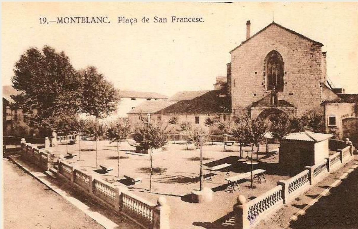
La plaça de Sant Francesc