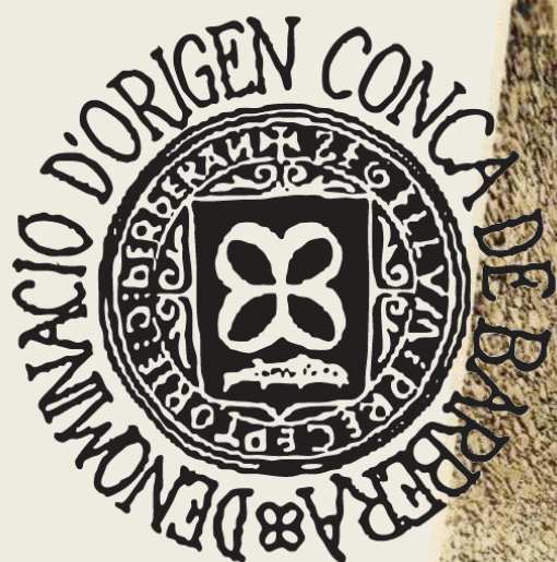
Segell de la DO Conca de Barberà