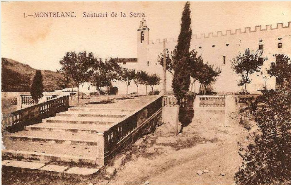
El convent de la Serra.

Cap a mitjan del s. XIV, la ciutat aconsegueix un alt nivell d'activitat econòmica, cosa que assegura i reforça el seu pes en el sentit polític i demogràfic, el que la situa a la setena posició de les principals poblacions catalanes. Continua la realització i l'acabament d'obres, i especialment el del seu espectacular emmurallat del s. XIV, en temps de Pere III el Cerimoniós, així com església gòtica de Santa Maria, un altre hospital, el de Sant Marçal, i el palau Alenyà. També es fan millores per a la població, com la cobertura del torrent anomenat Rivot , que fins llavors era un autèntica claveguera, i es fan uns bany públics, una presó, i diversos molins i forns.