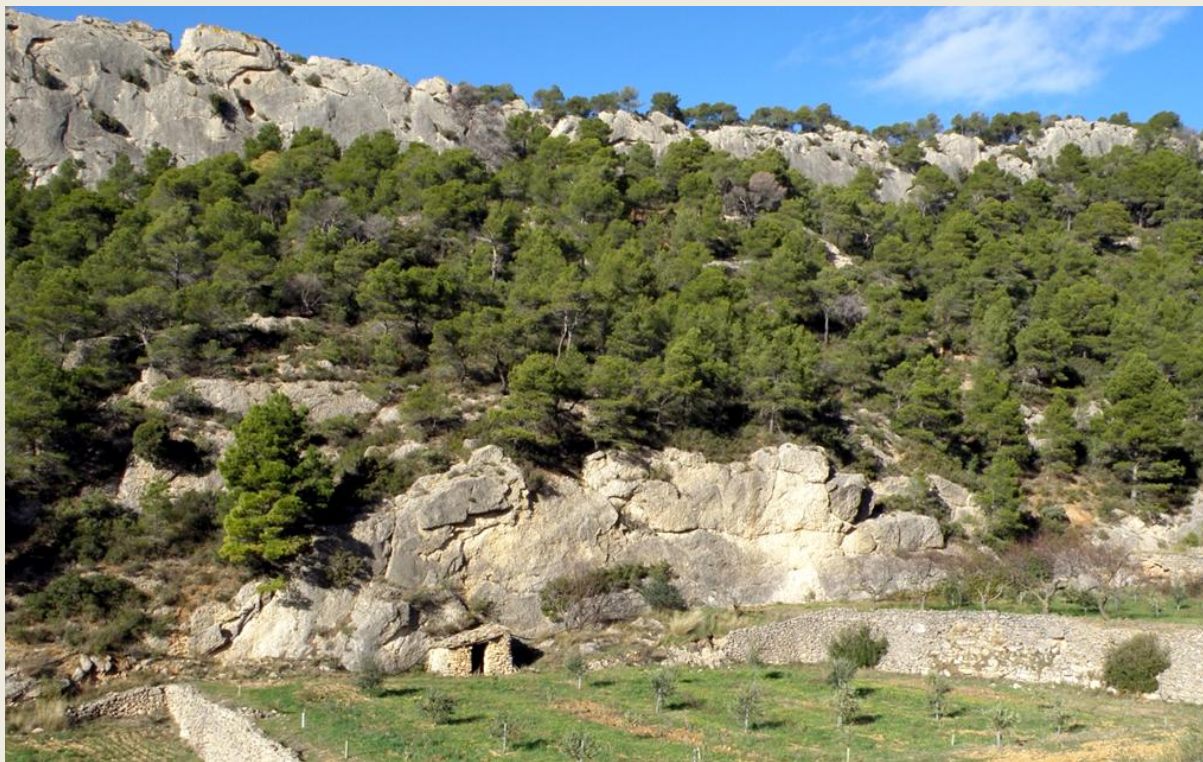
El racó de les Valls (Foto: R. Pascual).

aquesta regió es troben cabussats quasi 90°. El resultat és una successió de fondals sedimentaris organitzats en bancals de conreu alternats amb crestes rocoses quasi verticals. Durant la baixada observarem al marge dret del barranc el curiós monòlit anomenat la Geganta . La baixada pel racó de les Valls és ràpida i supera en poc més de 2 km els 275 m de desnivell respecte al nucli de Cabacés, final d'etapa. Cabacés és, amb 326 habitants empadronats el 2014, el poble més important dels tres que conformen el Montsant occidental (els altres dos són la Bisbal de Falset i Margalef que, junts, no arriben a aquesta xifra). Cabacés és conegut per trobar-se en un indret tancat i no s'observa des de gaire