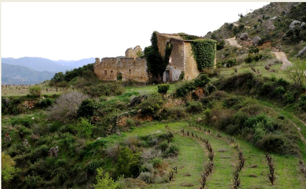
El mas de Sant Antoni, a l'indret on hi havia hagut l'antic poble de Montalt.

Passat el mas de Sant Antoni arribem, en menys d'1 km, a les proximitats del Mas Blanc , les restes del qual es poden veure a 80 m a l'esquerra del camí, en un petit altiplà situat a 700 m d'altitud, el segon punt més alt de l'etapa. Consta d'un edifici amb una planta de dimensions notables (uns 200 m 2 ). Lògicament, també pertanyia als dominis de la Cartoixa fins al 1835, data a partir de la qual va passar a mans privades, finalment de la família Faria, una altra de les grans d'Escaladei. Va ser habitat, com a mínim, des de l'últim terç del s. XIX fins als primers decennis del segle següent. Durant la Guerra Civil va ser habilitat com a hospital de sang . Posteriorment, les terres van seguir essent cultivades, sobretot amb sembrats, aprofitant els petits planets que envolten el mas. L'edificació va mantenir-se dempeus fins als anys 50 del segle passat.