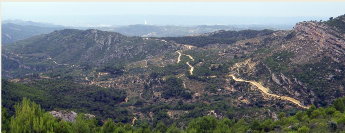
La partida de Cavalloques, des del grau del Caixer.

aquesta regió es troben cabussats quasi 90°. El resultat és una successió de fondals sedimentaris organitzats en bancals de conreu alternats amb crestes rocoses quasi verticals. Durant la baixada observarem al marge dret del barranc el curiós monòlit anomenat la Geganta . La baixada pel racó de les Valls és ràpida i supera en poc més de 2 km els 275 m de desnivell respecte al nucli de Cabacés, final d'etapa. Cabacés és, amb 326 habitants empadronats el 2014, el poble més important dels tres que conformen el Montsant occidental (els altres dos són la Bisbal de Falset i Margalef que, junts, no arriben a aquesta xifra). Cabacés és conegut per trobar-se en un indret tancat i no s'observa des de gaire