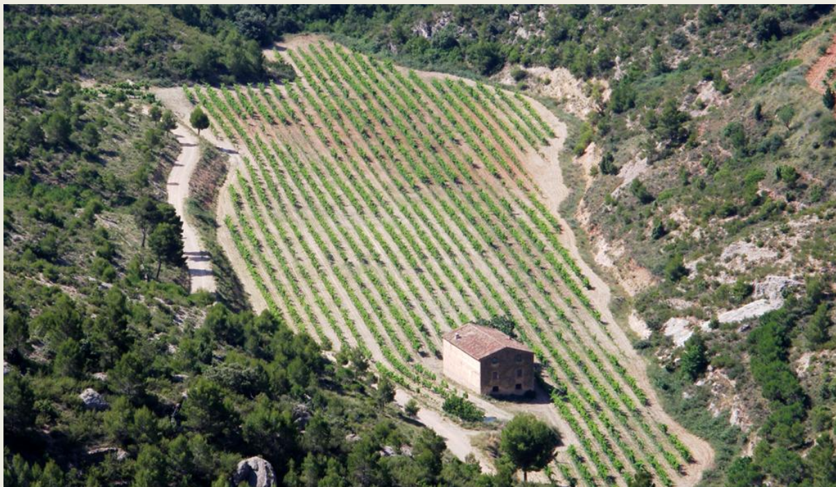
Des del cim del Montsant, s'aprecia el mas de Forçans amb el planet de vinya annex.

Si esteu interessants en aprofundir en la història i els usos dels masos del Montsant hi ha disponible un petit treball de recerca publicat en línia pel Parc Natural (seguiu l'enllaç ).