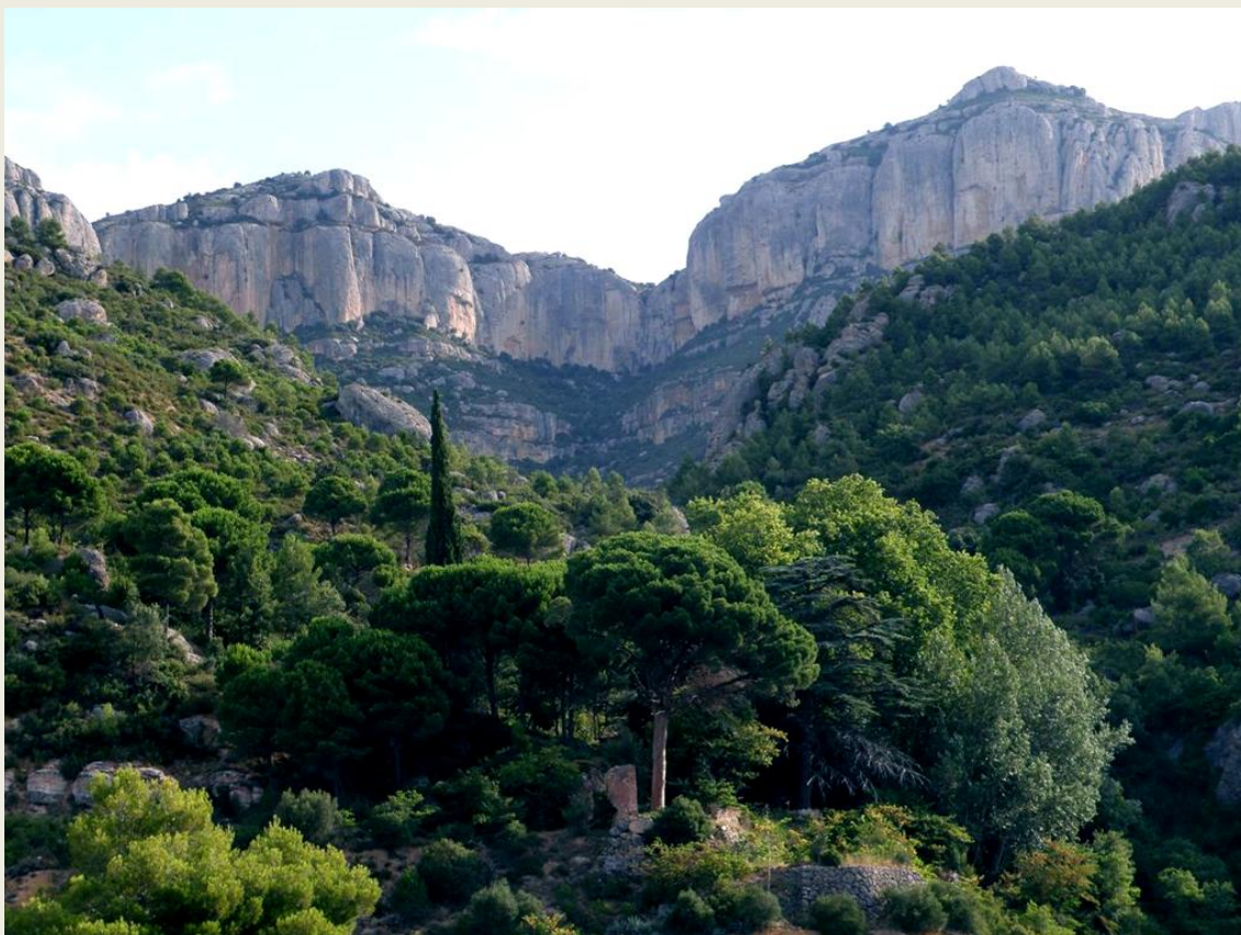
La casa de la Pietat resta oculta darrere dels arbres que l'envolten.

Deixarem la Pietat a la dreta i agafarem un sender en direcció oest que ens conduirà en pocs minuts a la font del Mas de Sant Antoni , una de les més importants del vessant meridional del massís. En aquest punt enllaçarem de nou amb un camí de carro que ens conduirà per les antigues propietats d'un conjunt de masos que es varen instal·lar a redòs de les últimes terres cultivables al peu dels pendents escarpats del Montsant.