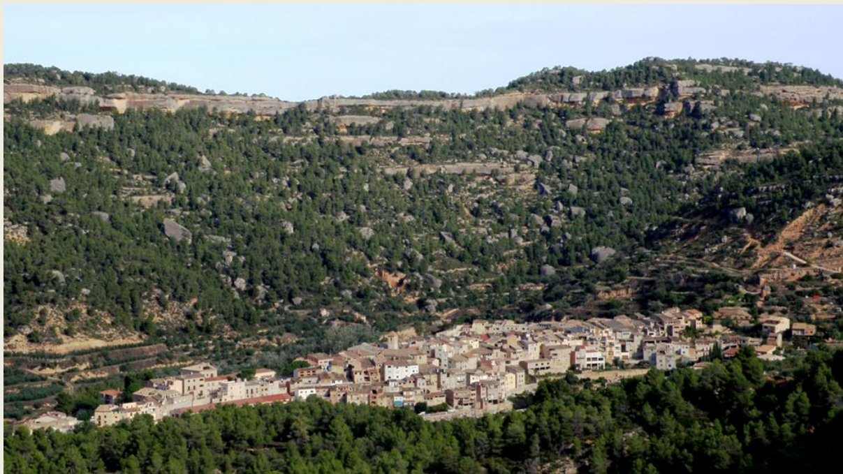
Cabacés, des del serrall de Cantacorbs.

Molí d'oli Miró-Cubells: http://www.molideloli.com/