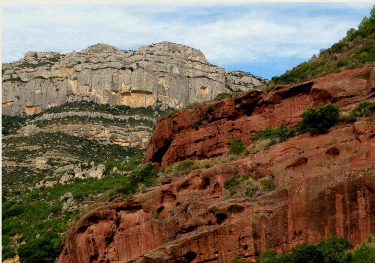
Baixant cap a la Cartoixa d'Escaladei apareixen a mà dreta les Coves Roges, una de les manifestacions del Triàsic inferior al Montsant (Foto: R. Pascual).

El camí ara baixa més decididament i en un parell de retombs es planta a la Cartoixa d'Escaladei , a 4,25 km del punt d'inici i 455 m d'altitud. Aquest és el primer monestir de l' orde de Sant Bru que es va fundar a la península Ibèrica. Si bé els cartoixans van arribar al territori reconquerit als sarraïns a finals del s. XII, no fou fins a principis del segle XIII (entre 1203 i 1215) que es va edificar la part més antiga del monestir, el qual es va anar ampliant fins a l'any 1403, moment en el que van conviure-hi 30 monjos i 15 llecs.