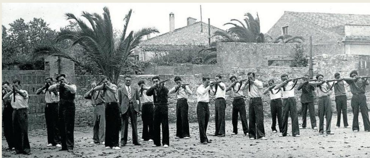
Els soldats de la lleva del "Biberó" fent instrucció, poc abans de ser enviats al front.

Aquesta heroica resistència es recorda i en fa homenatge el " Monument a la Pau " del 1989, just a la cota 705, promogut per la Lleva del Biberó i dedicat també a les Brigades Internacionals i a l'Associació dels Aviadors de la República. Cada any, pel setembre, es fa una ofrena floral per a tots aquells que hi van participar en el monument commemoratiu format per un gran dau de pedra que reproduïx en una de les cares un poema d'Antoni Correig Massó. A la concavitat de la cara principal hi ha gravat " El sol d'un nou dia " i, a l'interior, el colom de la pau.