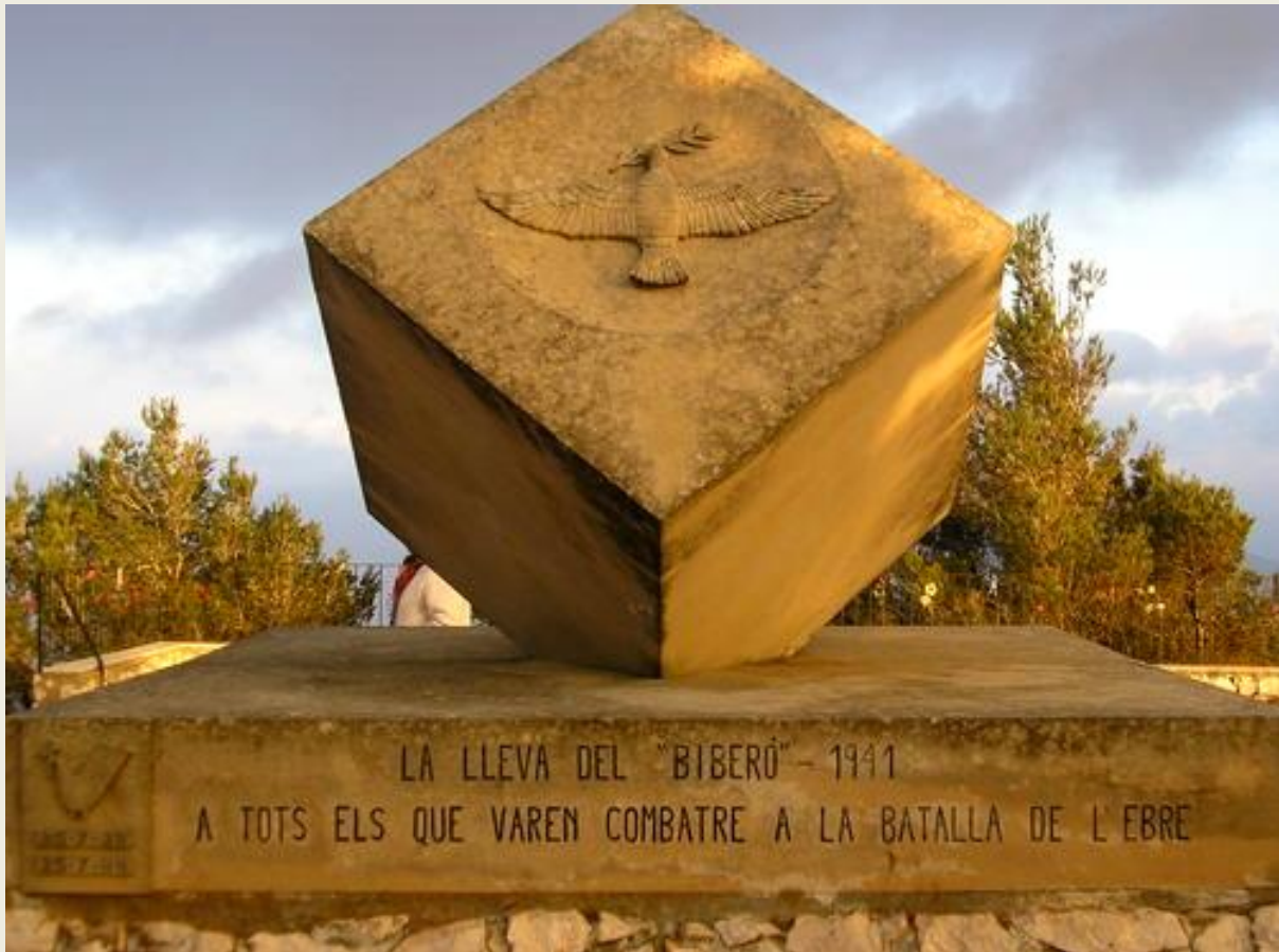
Monument a la Pau, promogut per la lleva del "Biberó".