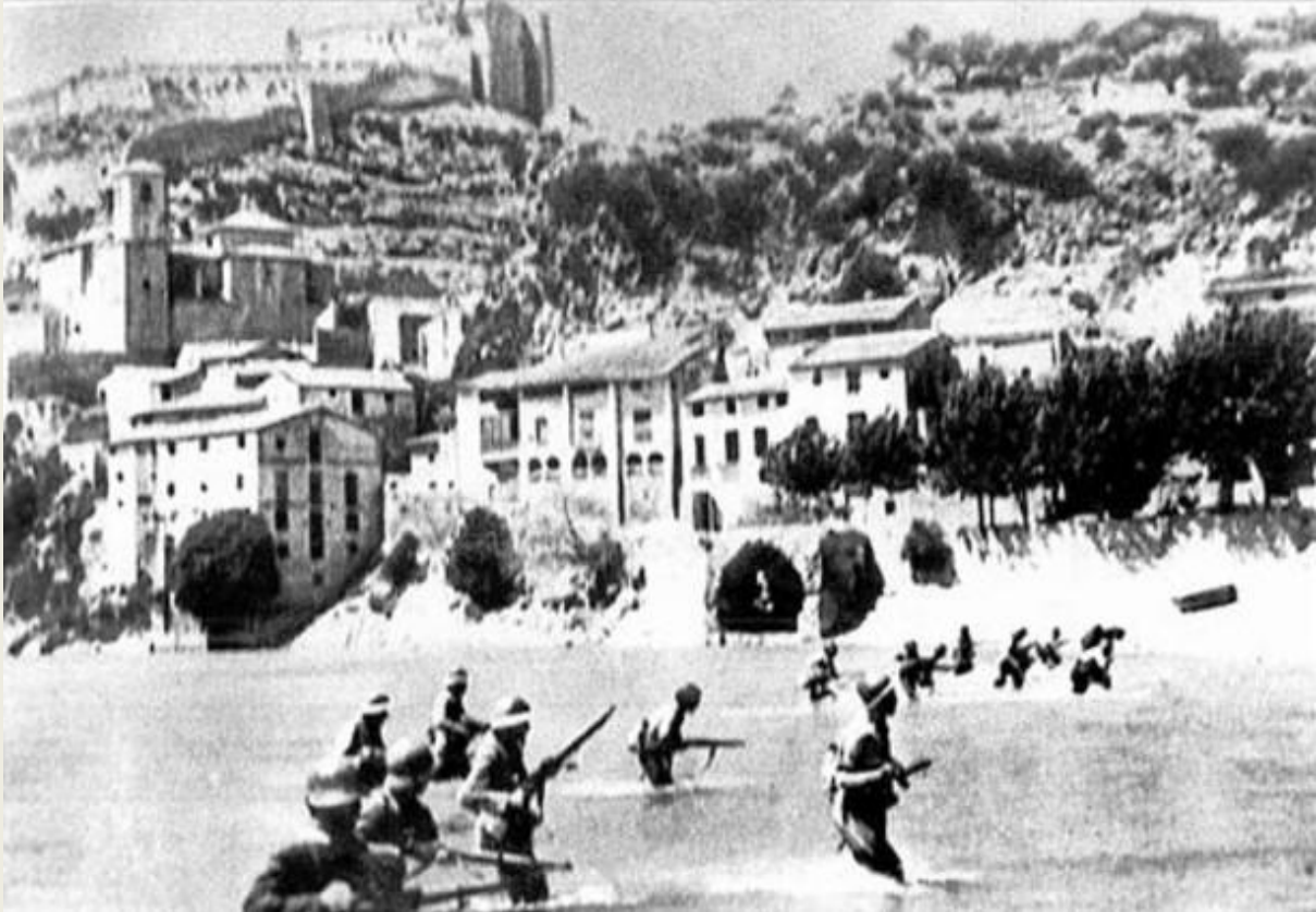
Al pas per Miravet.