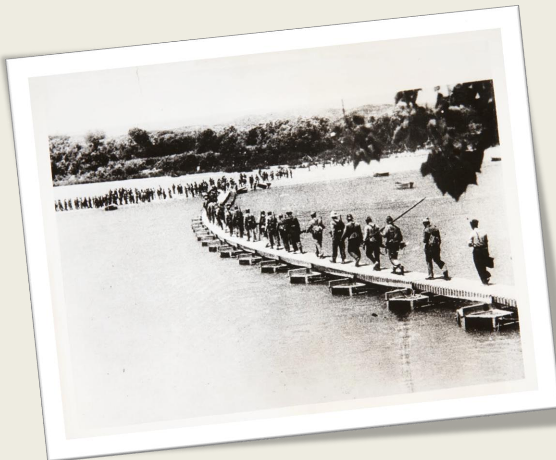
Tropes republicanes travessant l'Ebre.

de la seva població, una pèrdua que s'incrementà en les dècades posteriors per causa d'un territori desolat, pobles derruïts... infraestructures inservibles.